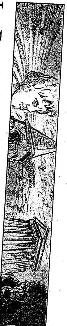
Episode 32 Une conférence Gallo romaine